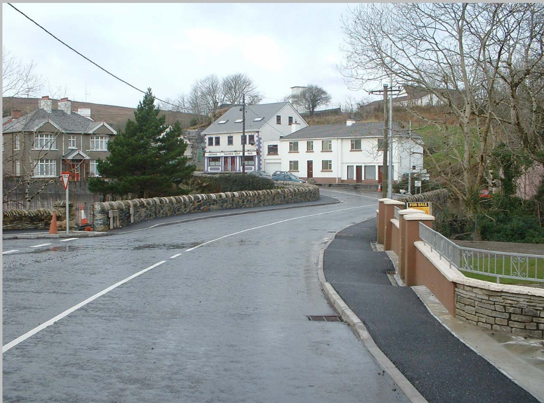
Droichead na Carrage