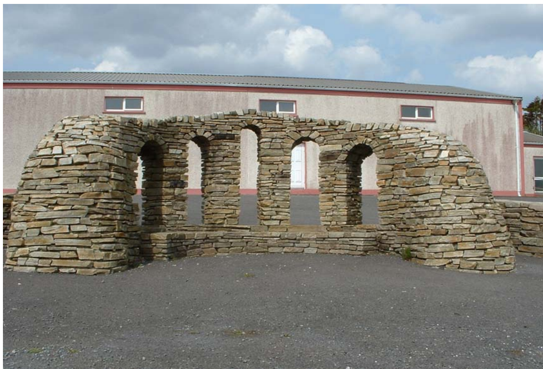
Ionad Pobail Mhín an Aoire