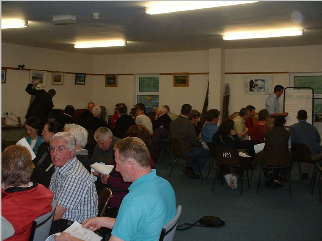
Cruinniú Poiblí in Oideas Gael